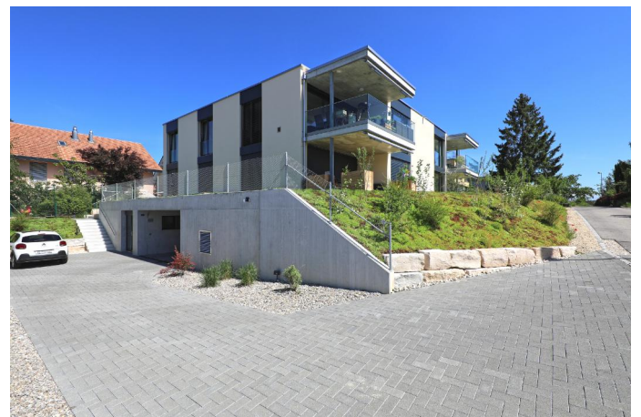
Ansicht West - Einfahrt Einstellhalle

Fertigstellung: 2019 Programm: 4 Wohneinheiten mit Einstellhalle Objekt: MFH Römerweg 4, 3232 Ins Energie: Minergie, Plusenergiehaus, Photovoltaik Volumen: 3'180m 3