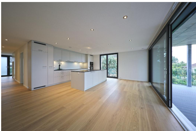
Wohnbereich Obergeschoss Ost